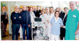
OSPEDALE DEI BAMBINI Il momento della donazione dell'ecografo.

L'Unione fa la forza: un principio che ha reso possibile il grande gesto di donazione di un ecografo all'avanguardia per l'Ospedale dei bambini di Parma. Un'operazione che ha coinvolto un centinaio di associazioni, aziende e privati cittadini. Il risultato è un grande successo: un ecografo portatile che sarà donato all'Ospedale dei bambini di Parma. L'operazione è stata coordinata da Net Project, l'associazione che organizza l'evento "La Cultura si fa Sport".